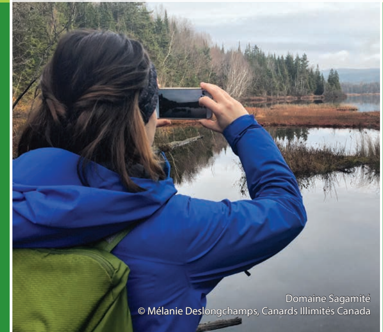
Domaine Sagamité

D'une superficie de 153 hectares, ce milieu humide filtre naturellement les éléments nocifs présents dans l'eau du bassin versant environnant, préservant ainsi la qualité de l'eau potable de la ville. C'est un des rares sites de cette superficie qui subsiste non loin de la ville et qui risquait d'être urbanisé. Il abrite toutes sortes d'amphibiens, de reptiles, de mammifères, d'oiseaux et de végétaux. Il constitue également une importante aire de nidification pour les canards noirs, les canards colverts et les fuligules à collier.