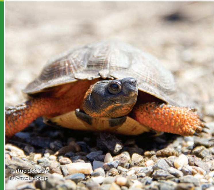
Tortue des bois

Avec ce deuxième acte de conservation, madame Côté entre dans le groupe des « récidivistes » de la conservation.