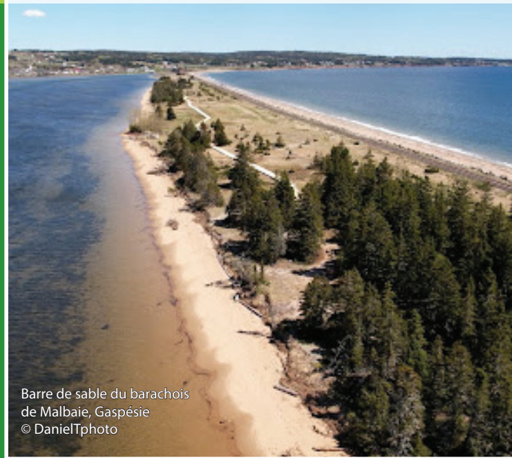
Barre de sable du barachois de Malbaie, Gaspésie

Conservation de la nature Canada a travaillé plusieurs mois sur un grand projet de restauration et de mise en valeur d'un paysage typique de la côte gaspésienne : la barre de sable du barachois de Malbaie. En bordure du golfe du Saint-Laurent, entre Percé et Gaspé, ce barachois est l'un des milieux humides les plus vastes et les mieux préservés de la Gaspésie. Dorénavant, vous y trouverez des aménagements pour protéger la nature, mais aussi pour accueillir les nombreux visiteurs qui s'y rendent chaque année.