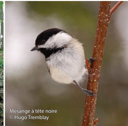
Mésange à tête noire