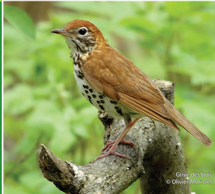
Grive des bois

Avec la coordination de Nature-Action Québec et de Connexion Nature, les 12 organismes de conservation formant la Coalition des Montréalaises ont collaboré à la production de onze plans locaux de conservation ainsi qu'un plan régional de conservation et de connectivité écologique. Définir, connaître, concevoir et planifier sont les quatre grandes sections qui composent ces plans et qui ont mené à l'identification de nombreuses actions à mettre en œuvre pour concrétiser la protection de ces collines uniques.