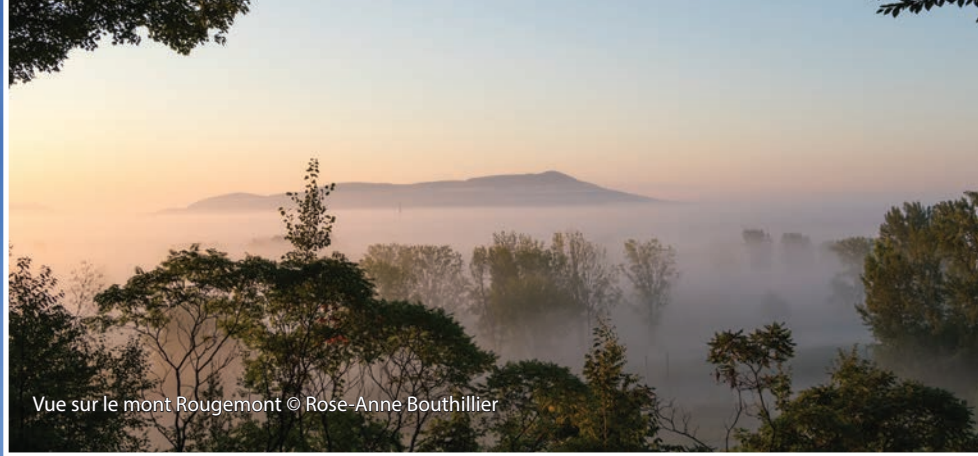
Vue sur le mont Rougemont