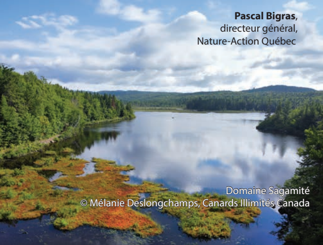
Domaine Sagamité