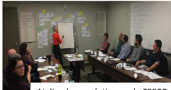
Atelier de co-création par le CRECQ

Trois ateliers de co-création ont été organisés (Gaspésie, Trois-Frontières/Témiscouata et Centre-du-Québec) et ont permis de développer une vision commune et spécifique pour la zone visée et d'identifier des obstacles à l'atteinte de cette vision. Une vingtaine de participants de diverses institutions étaient présents à chacun de ces ateliers.