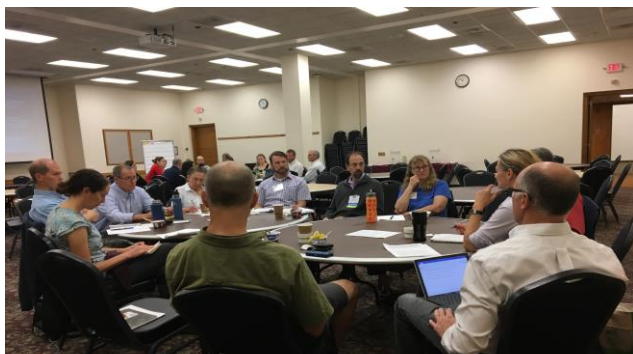
Atelier sur la Résolution 40-3

Des nouvelles concernant le projet ont été publiées dans les bulletins de l'Initiative Staying connected .