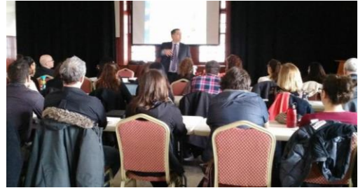
Formation pour les MRC/Municipalités à Prévost (Laurentides)

L'Initiative Staying Connected a transféré des connaissances aux maîtres d'œuvre via deux webinaires et, en collaboration avec l' Ontario Road Ecology Group , a créé un portail Route et Faune afin de mettre en valeur les projets d'écologie routière. Diverses ressources sont également accessibles via leur site web .