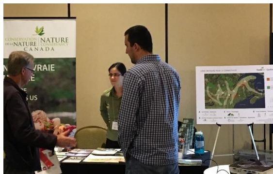
Congrès de l'Association forestière du sud du Québec