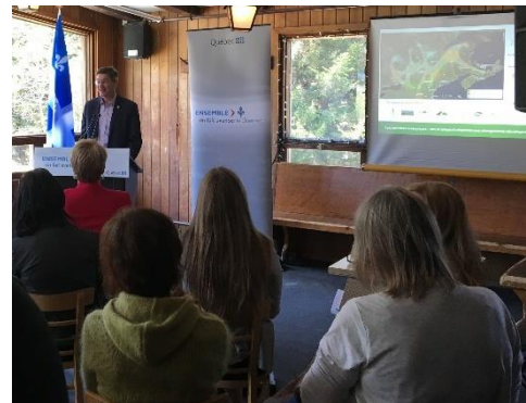
Conférence de presse avec la ministre de l'Environnement et de la Lutte contre les changements climatiques, Mme Isabelle Melançon.

Le projet a été présenté lors de trois événements : Colloque sur l'écologie routière et l'adaptation aux changements climatiques : de la recherche aux actions concrètes (Québec - octobre 2017), Forum des rendez-vous de l'Atlas (Drummondville - avril 2018) North American Congress for Conservation Biology (Toronto - juillet 2018).