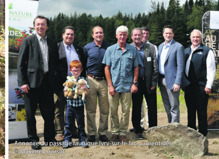
Annnonce du passage faunique Ivry-sur-le-lac, Laurentides