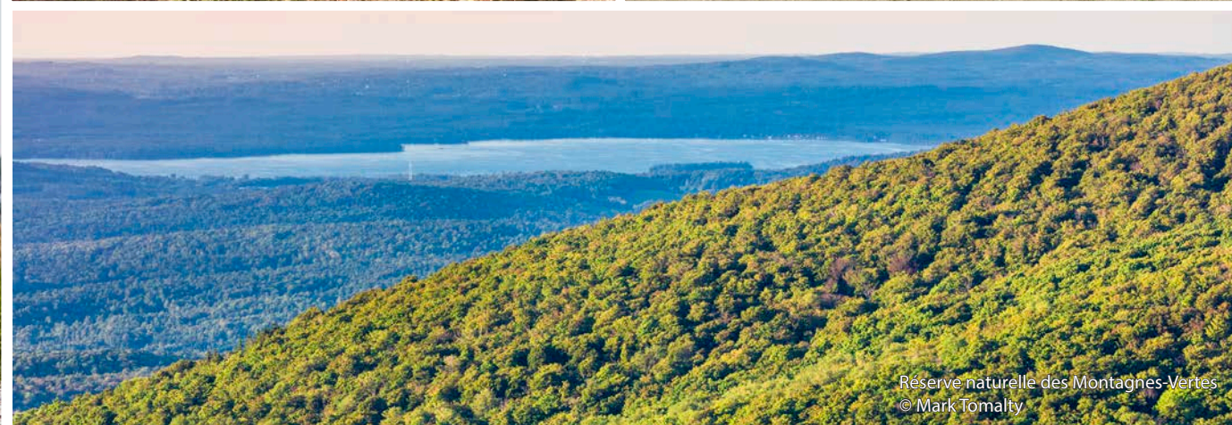
Réserve naturelle des Montagnes-Vertes © Mark Tomalty