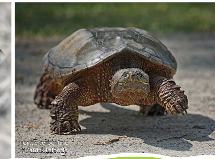
Tortue serpentine