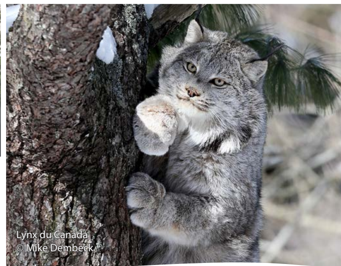
Lynx du Canada