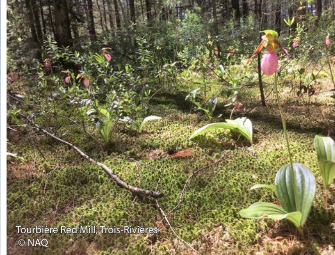
Tourbière Red Mill, Trois-Rivières